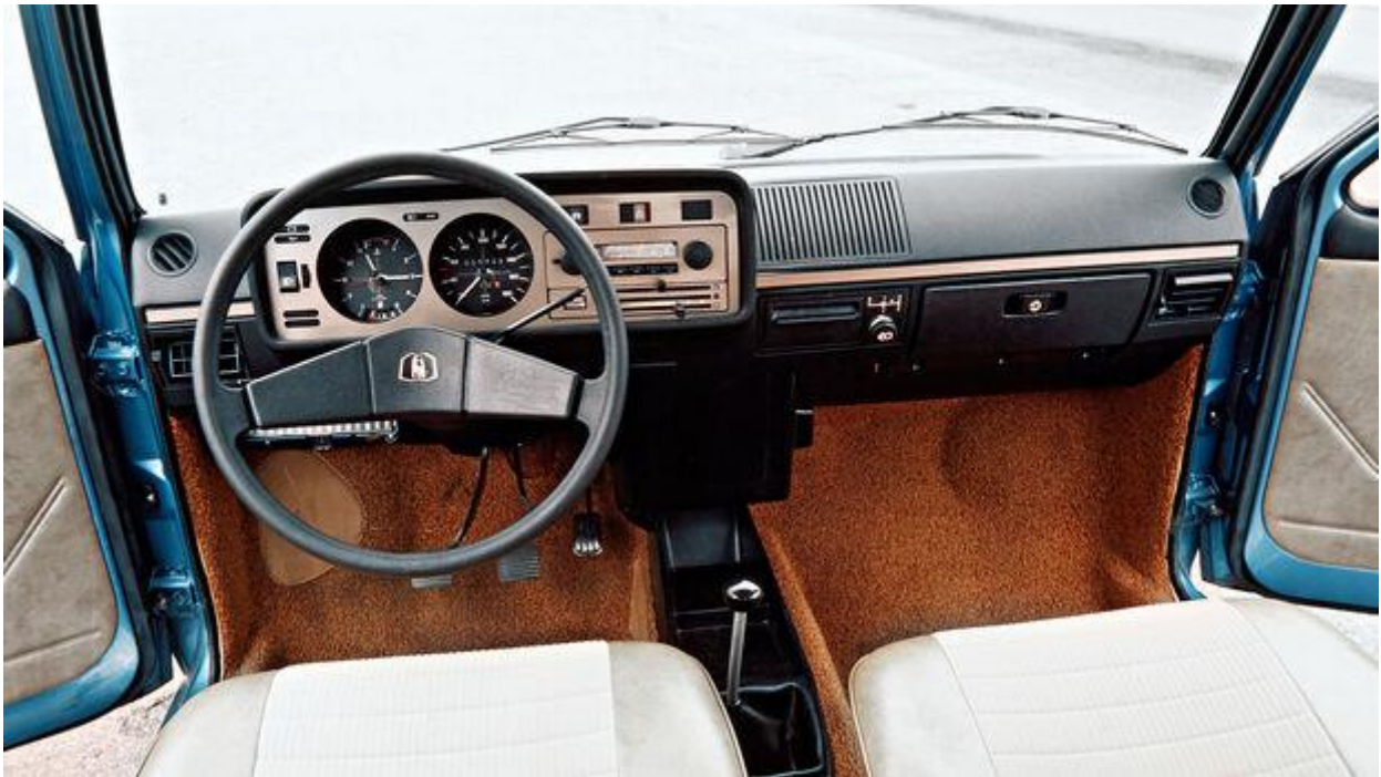
Hans Peter Seufert Funktionales Golf-Cockpit mit gehobener L-Ausstattung.

Im übrigen fühlt man sich, zumindest in der L-Version, reichhaltig mit Ausstattung umgeben. Und es fehlt nicht an Funktionalität: Die Betätigungshebel liegen griffgünstig, das Schema für die Heizungsbedienung fiel klar und übersichtlich aus, und schließlich zeigt auch das Armaturenbrett, dass man sich um Sachlichkeit bemüht hat. Hier gibt es, auf eloxiertem Untergrund, zwei Rundinstrumente, von denen das linke Kombi-Charakter hat: Es zeigt zunächst einmal sehr großzügig die Uhrzeit an und informiert darüber hinaus, durch eingearbeitete Klein-Instrumente, über die Wassertemperatur und den Tankinhalt. Zur rechten wird einzig das jeweilige Tempo aufgezeichnet – in unmittelbarer Nähe des gegen Aufpreis lieferbaren Radios, das sich an dieser Stelle bestens bedienen lässt. An die Hupe kommt man dagegen ein bisschen zu gut; die für die Auslösung dieses Signals zuständige Prallplatte spricht auf zarteste Fingerdrücke an und erteilt den akustischen Befehl auch noch aus den Randzonen, die man meist zufällig berührt.