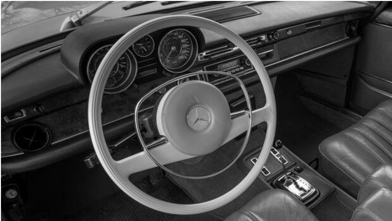
Das Cockpit des Mercedes 300 SEL 3,5.

Was der Mercedes hier an Fahrkomfort bietet, kann der Opel nicht erreichen — er ist um eine Klasse unkomfortabler. Bei langsamem und schnellem Fahren spürt man viel mehr von den kleinen und großen Unebenheiten, die es in der Stadt ebenso gibt wie auf Landstraßen und Autobahnen. Zwar ist es nicht so, dass man in unqualifizierter Weise gerüttelt und gestoßen wird. Aber von dem perfektionierten Federungskomfort des Mercedes ist der Opel noch weit entfernt. Man darf diesen Komfort nicht mit Weichheit verwechseln, denn die Luftfederung des 300 SEL wirkt keineswegs weich, sondern eher straff. Aber wie sie von jeder Unebenheit alles wegschluckt, was stören könnte, wie sie auch kleinste Wellen- oder Querfugeneinflüsse absorbiert, das ist kaum zu übertreffen. Tatsächlich dürfte es nur ein Auto geben, das noch besser gefedert ist: den 600, der das gleiche Federsystem, aber noch mehr Radstand und Gewicht zu bieten hat.