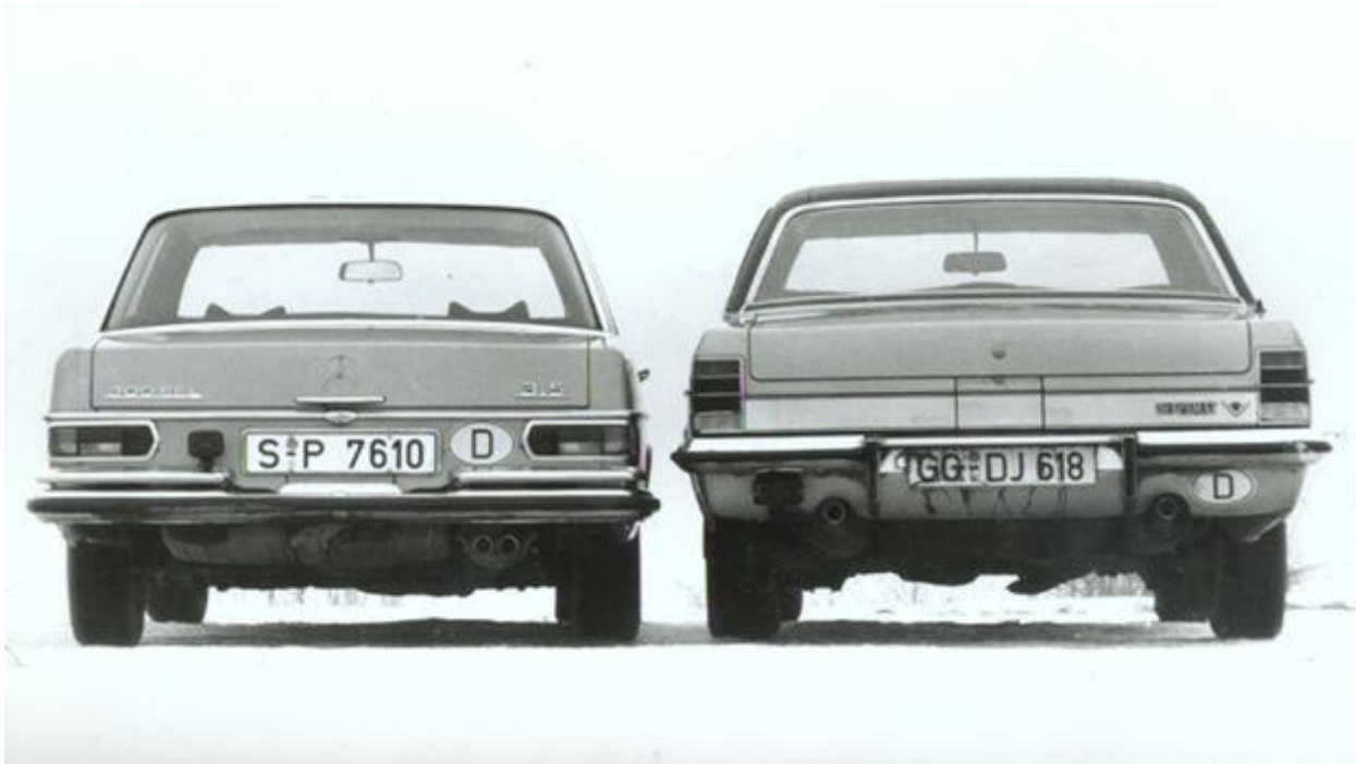
Zwei V8-Limousinen im Duell.

Stehen wir am Beginn einer neuen Ära in der Prestigeklasse? Daimler-Benz scheint davon überzeugt zu sein, und auch Opel hat in den Diplomat mehr Aufwand investiert als jemals in ein anderes Rüsselsheimer Auto. Zwar kann es bei uns nicht so kommen wie in den USA, wo fast jede Hausfrau in einem großvolumigen V 8 zum Einkaufen fährt. Aber wer einigermaßen repräsentationsfreudig ist, der wird künftig mit acht Zylindern aufkreuzen müssen.