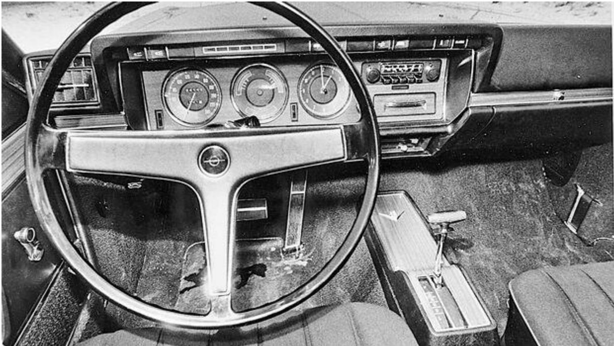
Das Cockpit des Opel Diplomat.

Wenn es hier etwas zu vergleichen gibt, dann nicht die Leistung, sondern den Charakter der beiden Motoren. Opels 5,4 Liter V 8 stammt von Chevrolet und ist ein typischer amerikanischer Großserienmotor mit Vergaser und zentraler Nockenwelle. Seine Kraft holt er aus dem Hubraum, das maximale Drehmoment von 43,5 mkg erreicht er bei 3.000 U/min, die Höchstleistung bei 4.700 U/min. Der 3,5 Liter V 8 von Daimler-Benz dagegen ist ein Hochleistungsmotor europäischer Schule mit elektronischer Benzineinspritzung und je einer obenliegenden Nockenwelle pro Zylinderreihe. Er ist auf hohe Drehzahlen ausgelegt. Weil das Drehmoment hauptsächlich vom Hubraum abhängt, kann er nur 29,25 mkg bieten, die erst bei 4.000 U/min erreicht werden. Die Nenndrehzahl beträgt 5.800 U/min, die Höchstdrehzahl 6.500 U/min.