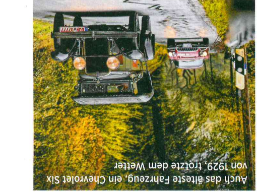
Auch das älteste Fahrzeug, ein Chevrolet Six von 1929, trotzte dem Wetter