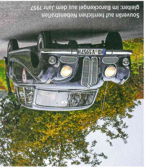
Souverän auf herrlichen Nebenstraßen gleiten: im Barockengel aus dem Jahr 1957