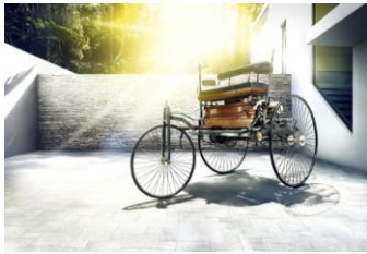
Bildnummer: patentwagen_cover_69 Benz Patent-Motorwagen aus dem Jahr 1886 (Replica), das erste Automobil der Welt.