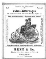
Bildnummer: 22584 Werbeplakat Benz Patent-Motorwagen.