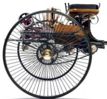
Bildnummer: mb_hinterrad_24 Benz Patent-Motorwagen, 1886 – das erste Automobil der Welt.